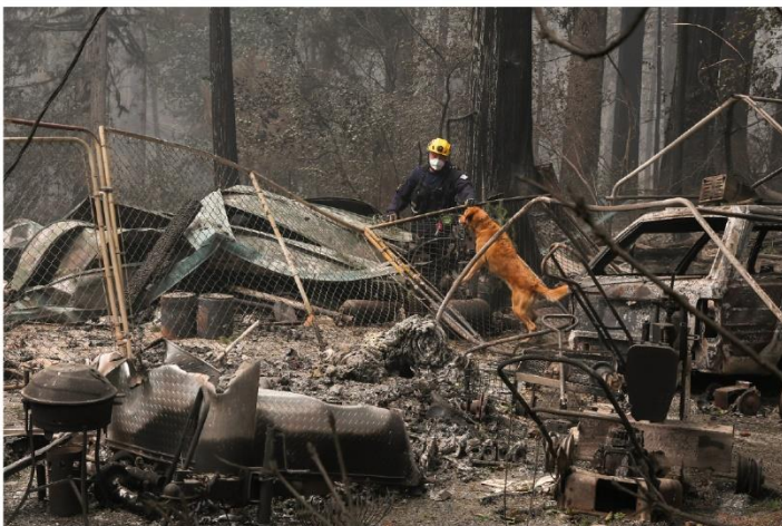
Поиск и спасение в Блу Ривер, Орегон. 15 сентября 2020 г.

Администрация по делам малого бизнеса США (Small Business Administration) предоставляет низкопроцентные займы для пострадавших от бедствий домовладельцам, арендаторам и предприятиям. Звоните в SBA по номеру 1-800-659-2955 или посетите веб-сайт www.sba.gov/services/disasterassistance